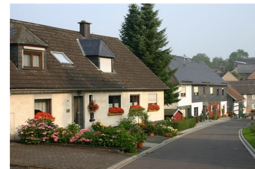
Gästewohnung Meier Talweg 4 57612 Giesenheim

Ländlich ruhig im Westerwald in der „Kroppacher Schweiz“